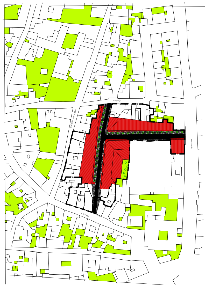
estado reformado imagen final