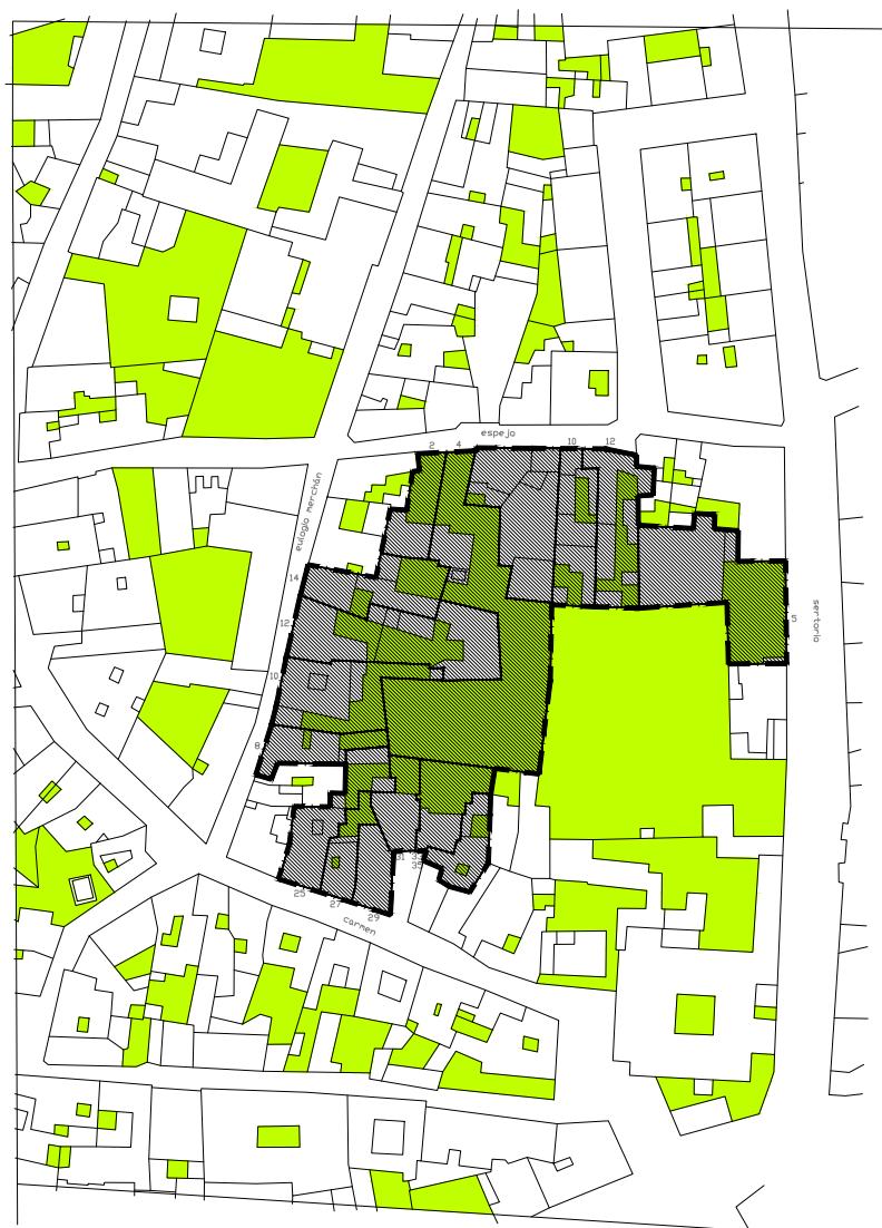
estado actual edificabilidad planta baja