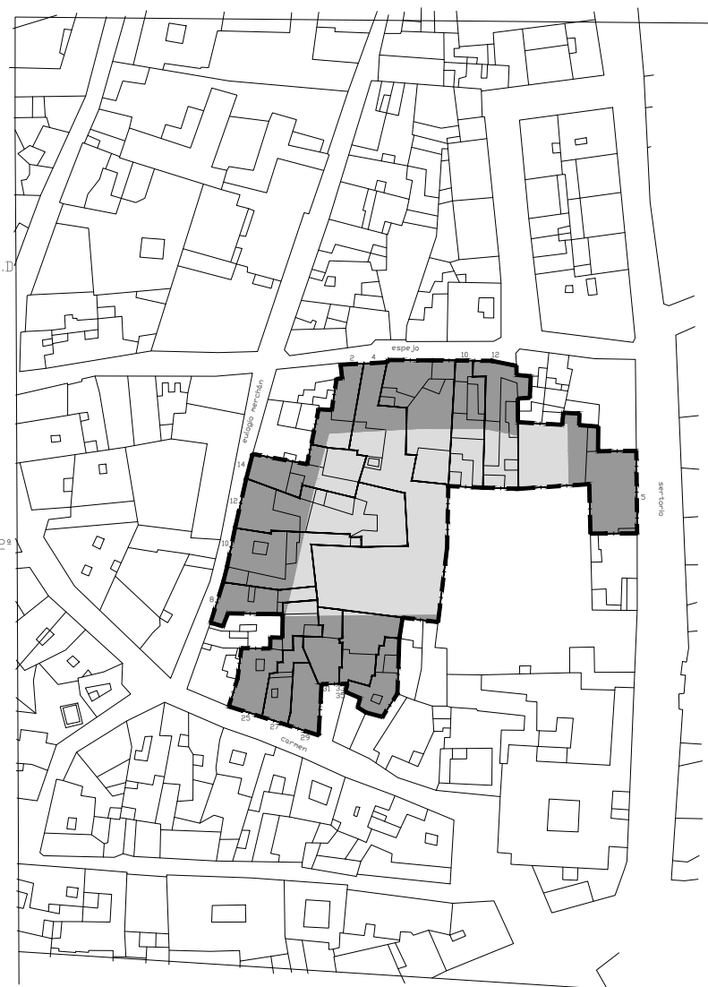
estado actual edificabilidad plantas primera y segunda