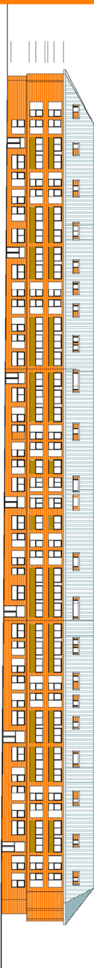
AZADO FACHADA CALLE LIBERTAD

mira el sol, 11, local izq. madrid 28005 T +91.527.44.34 M +661.81.56.52 F +91.527.44.34 info@julio Prado.es www.julio Prado.es